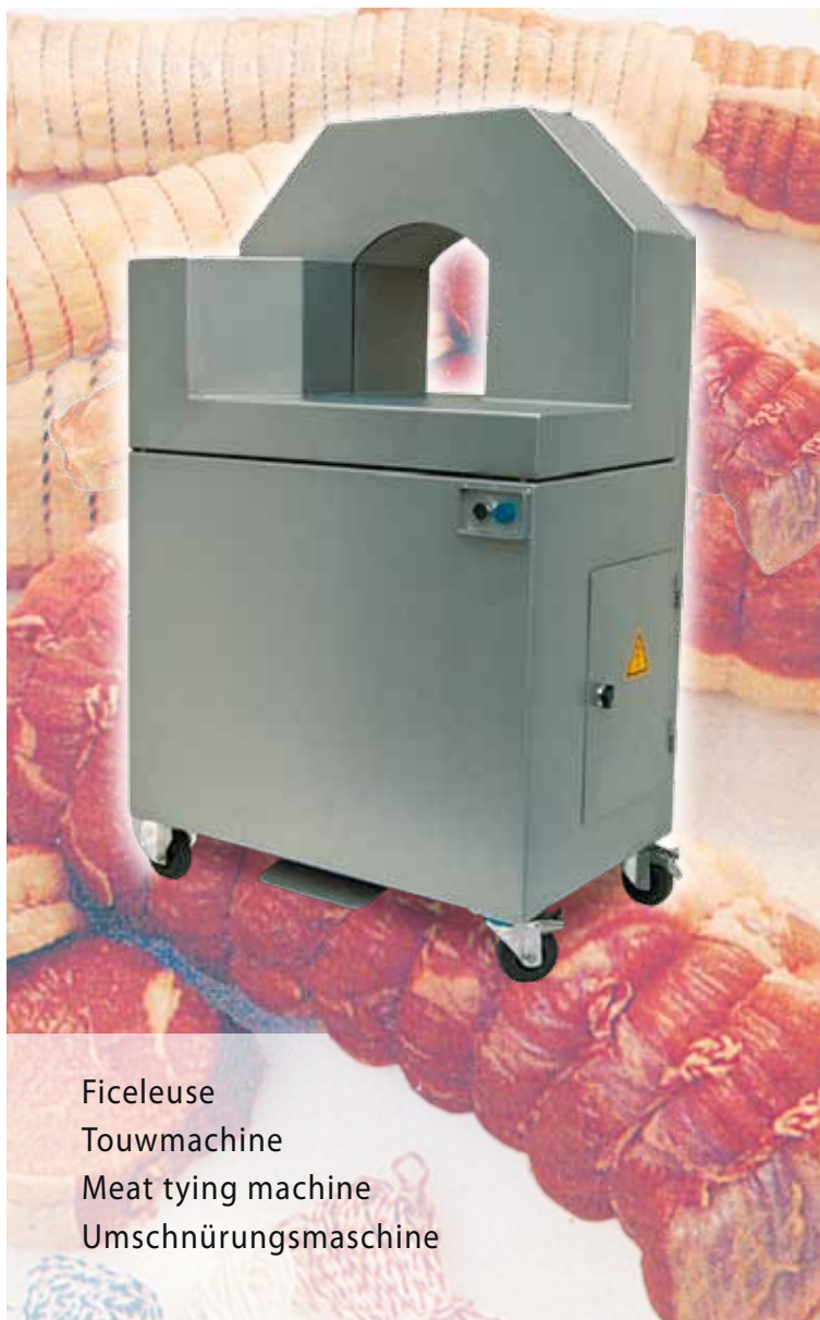
Ficeleuse Touwmachine Meat tying machine Umschnürungsmaschine